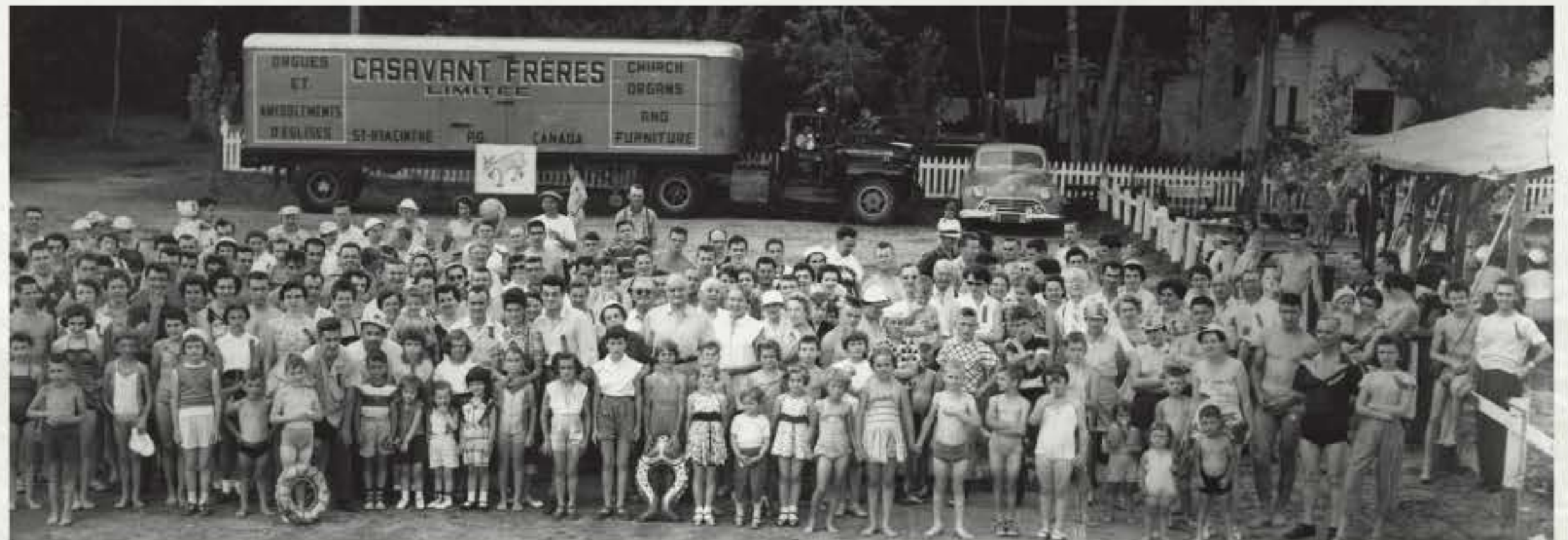
Pique-nique annuel des employés de la manufacture Casavant Frères en 1958.