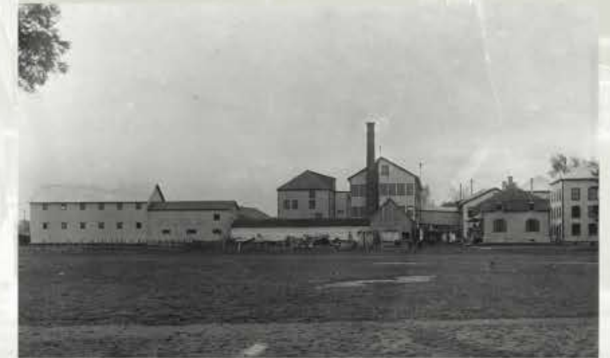
Vue générale des bâtiments de la fabrique vers 1910.