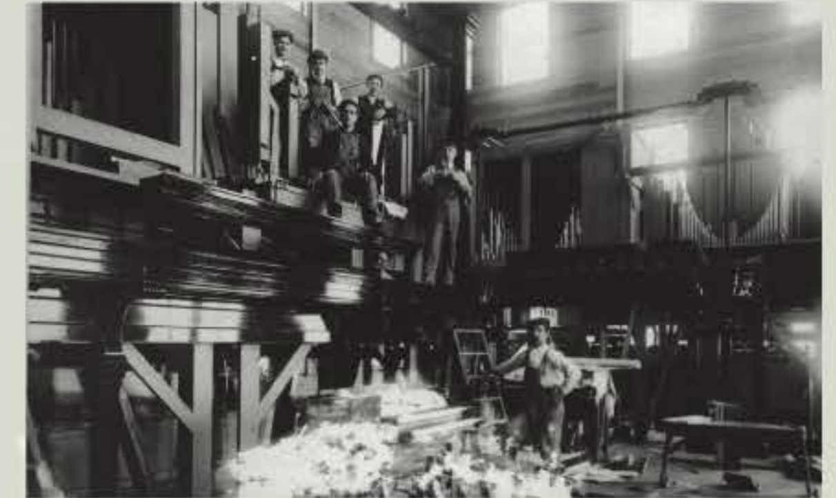
Quelques ouvriers de la maison Casavant Frères en 1919.

La crise économique des années 1930 frappe durement l'entreprise qui diversifie ses activités en inaugurant un département d'ébénisterie. Les affaires finissent toutefois par reprendre après la Seconde Guerre mondiale et depuis, le succès de Casavant Frères ne se dément pas. Au tournant de l'an 2000, la maison pouvait ainsi se targuer d'avoir produit, depuis sa fondation, plus de 3800 orgues.