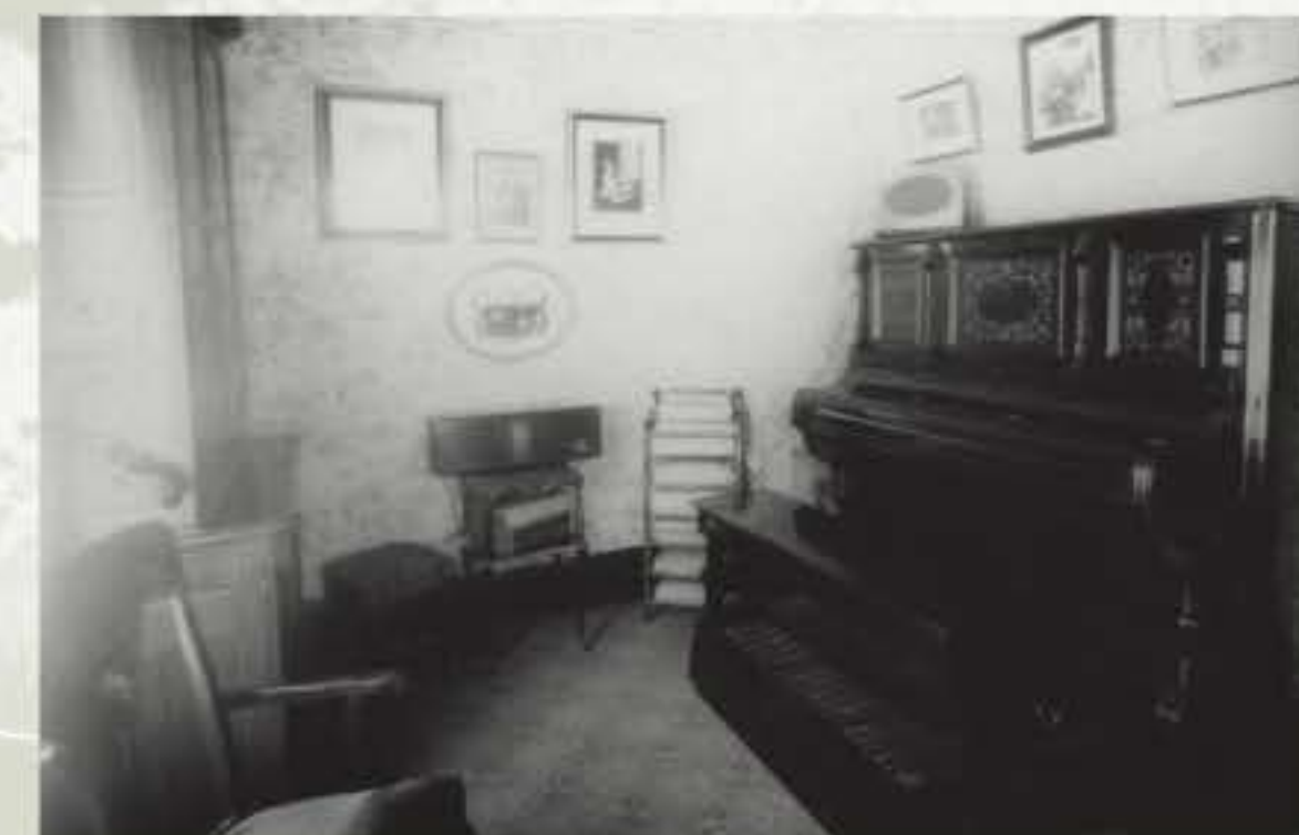
Le boudoir de la villa Casavant.