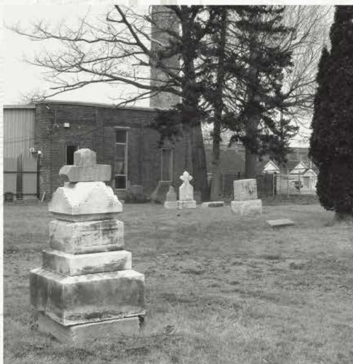
Cimetière anglican, sur le site de l'ancienne église démolie en 1976.