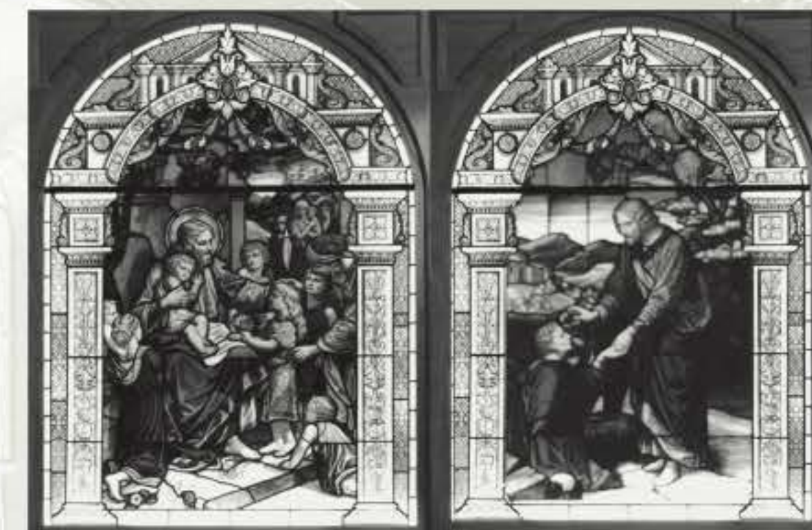
Vitraux installés dans le chœur de l'église presbytérienne de 1921 à 1981.

Finalement, après avoir abrité une congrégation pentecôtiste de 1971 à 1981, la petite église change complètement de vocation et devient un édifice commercial.