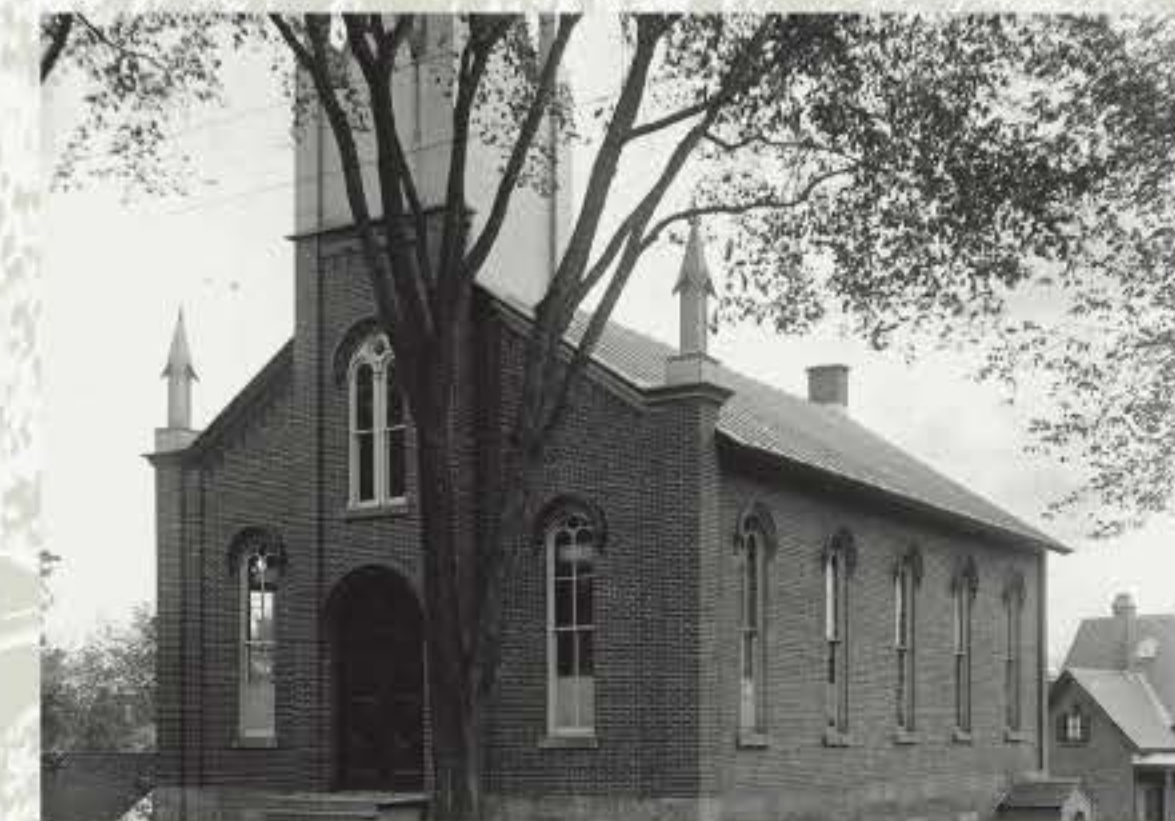
L'église presbytérienne vers 1912.

Afin de loger le pasteur, en 1894, on ajoute un presbytère situé à l'arrière de l'église, à l'emplacement actuel du terminus d'autobus. L'école pour les jeunes protestants du pasteur Duclos est déménagée dans le sous-sol de l'église, jusqu'à ce qu'un nouvel édifice soit construit en 1919, au 675 avenue Sainte-Marie.