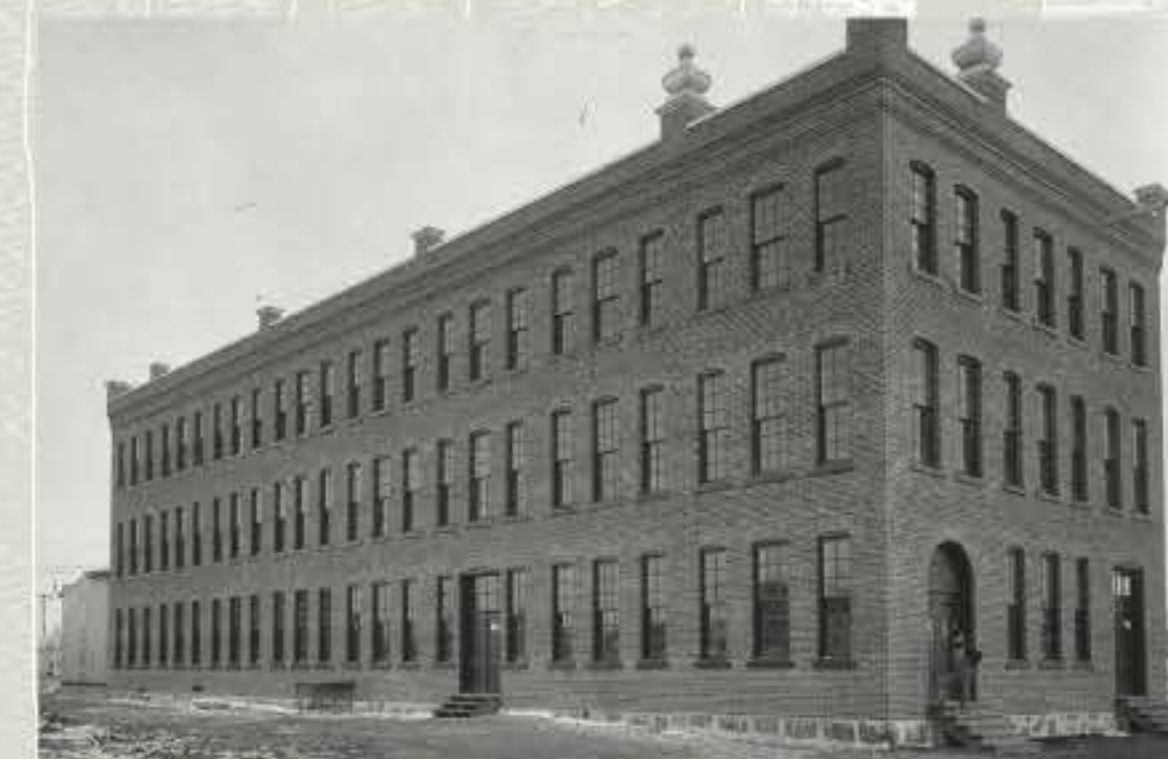
La manufacture J.A. & M. Côté vers 1910.

En hommage à cet homme exceptionnel, en 1900, la municipalité donna son nom au parc situé près de la Porte des Anciens Maires.