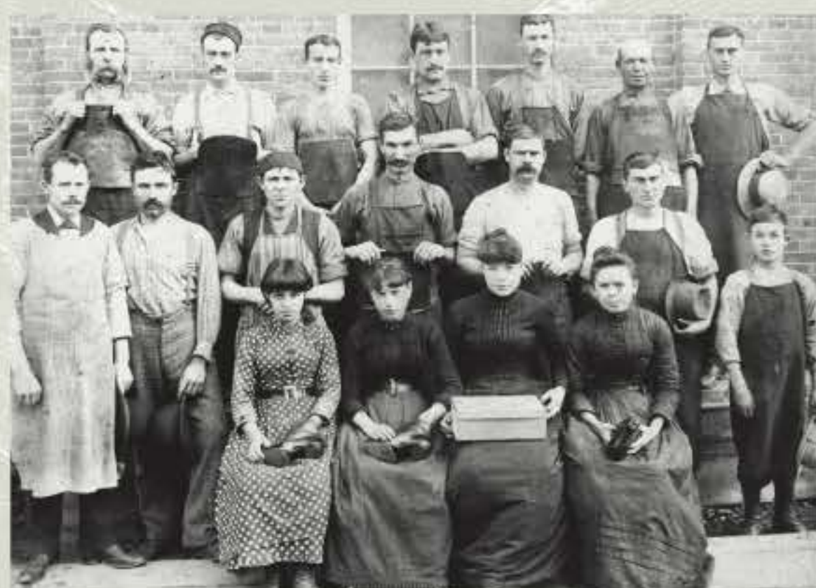
Employés d'une manufacture de chaussures vers 1900.

Au Québec, l'industrie de la chaussure prend en effet une expansion remarquable à partir des années 1860, tout comme celle des tanneries qui y sont liées. À une certaine époque, Saint-Hyacinthe compte jusqu'à cinq manufactures de bottes et chaussures concurrentes! Mentionnons ainsi la Eastern Township Shoe, les chaussures Séguin et Lalime, la Victoire Shoe et la Rita Shoe. Aucune d'entre elles n'atteindra cependant la prospérité des entreprises Côté.