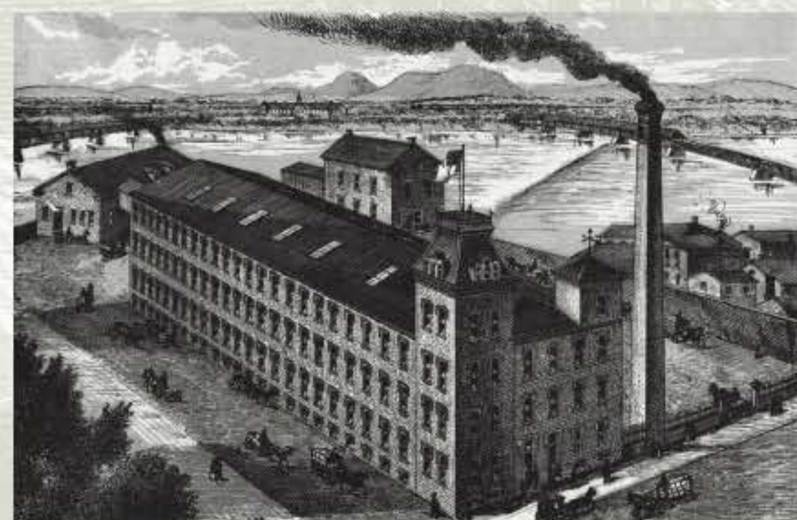
Fabrique de chaussures Louis Côté et Frères sur les bords de la rivière Yamaska, vers 1886.