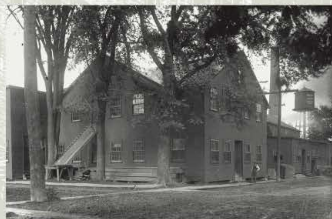
La tannerie Duclos & Payan, l'une des plus importantes de la ville.